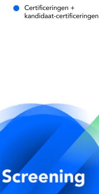
Certificeringen (boekjaar 2019)

● Certificeringen + kandidaat-certificeringen